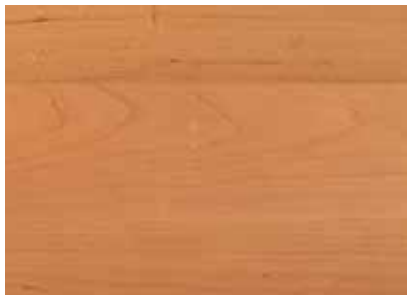
CILIEGIO AMERICANO - AMERICAN CHERRY Provenienza: America settentrionale Origin: North America