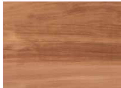
CABREUVA INCIENSO Provenienza: America meridionale Origin: South America