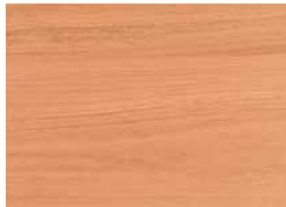
DOUSSIÈ Provenienza: Africa tropicale occidentale Origin: Tropical West Africa