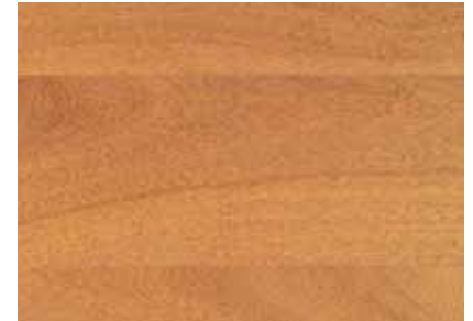
IROKO Provenienza: Africa tropicale occidentale Origin: Tropical West Africa