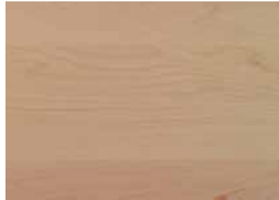
ACERO - HARD MAPLE Provenienza: America settentrionale Origin: North America