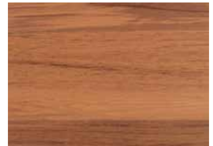
TEAK ASIA - ASIAN TEAK Provenienza: Asia Origin: Asia