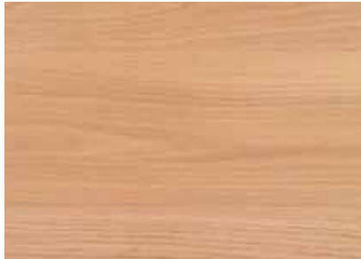
ROVERE - OAK Provenienza: Est Europa Origin: East Europe