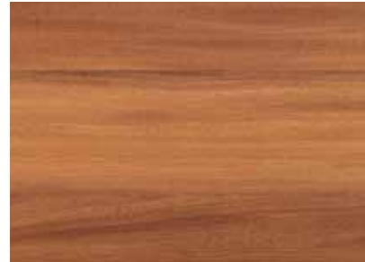
AFRORMOSIA Provenienza: Africa tropicale occidentale Origin: Tropical West Africa